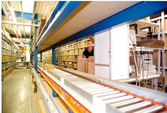
Abbildung 1: Im PEARL-Versand

PEARL – führend beim Online-Computerzubehör Mit über fünf Millionen Kunden in Deutschland, Österreich, der Schweiz und Frankreich zählt PEARL mittlerweile zu den größten Versandhandelsgruppen für PC-Software, Computerzubehör sowie Drucker-Verbrauchsmaterial in Europa.